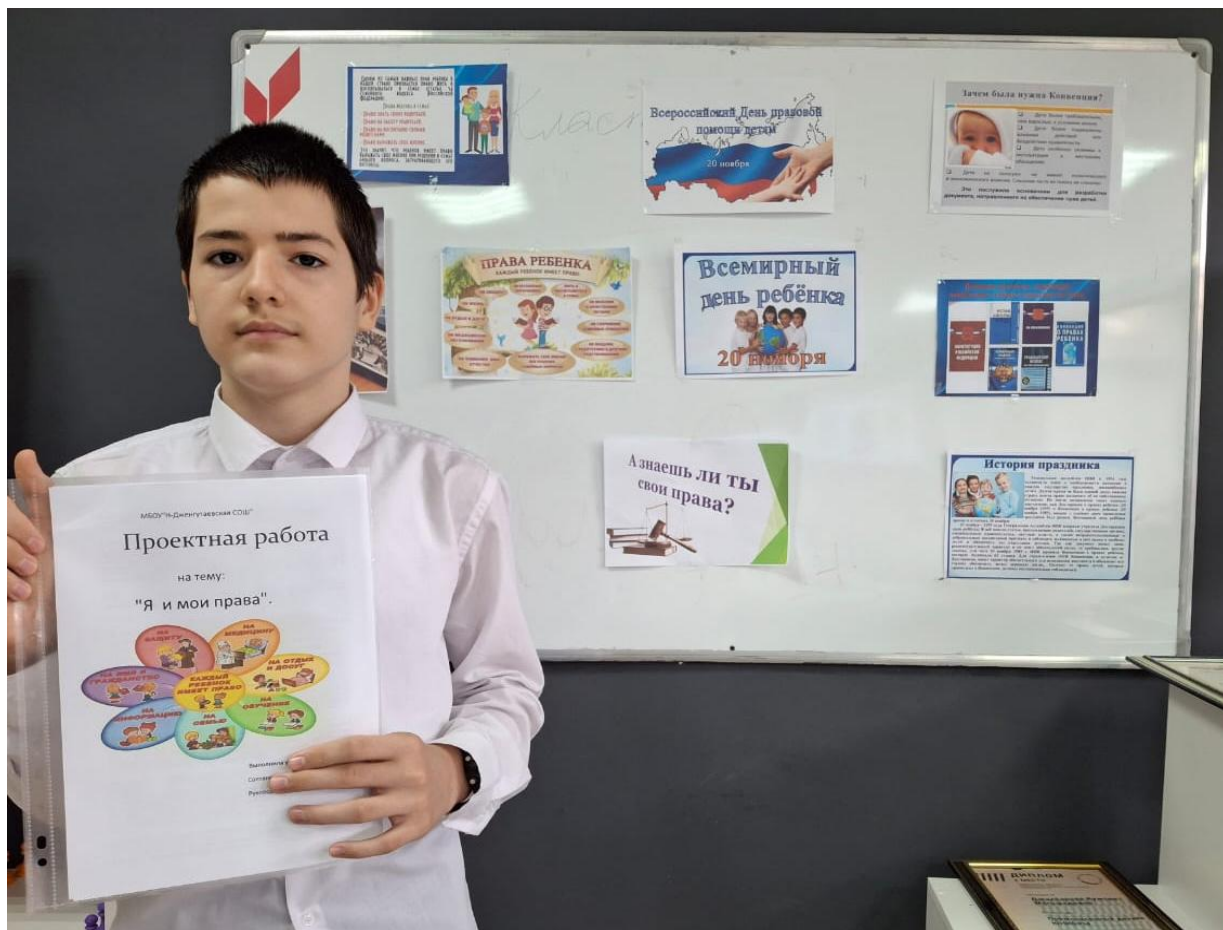
Организована выставка проектных работ и в рамках НЕДЕЛИ ПРАВОВЫХ ЗНАНИЙ