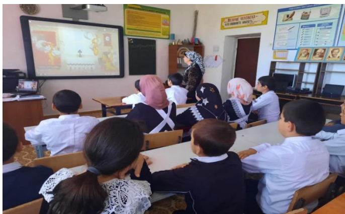
Кл. час «Права и обязанности» 6 В класс