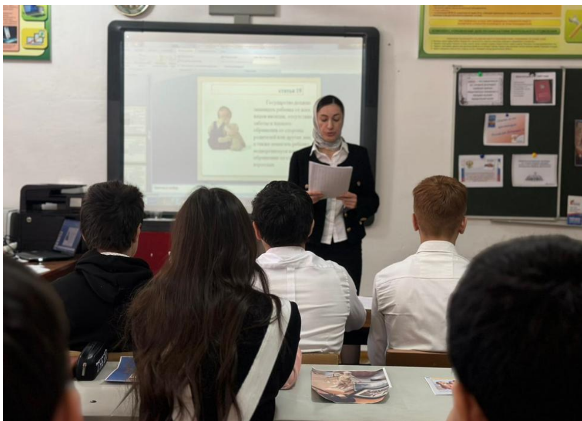
Викторина «Мир прав детей» 11 класс