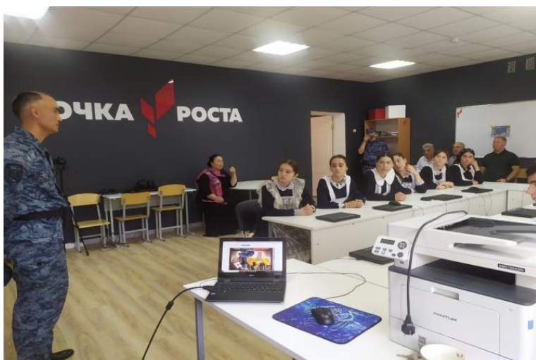
Беседа с учащимися с приглашением представителей КПП «Буглен»