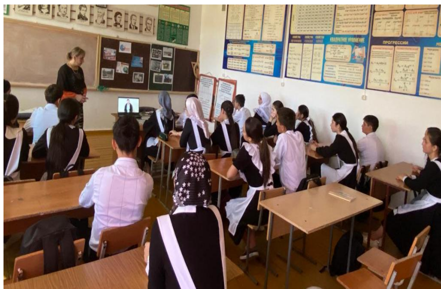
Просмотр фильма «Доброта приносит радость» 9В кл.