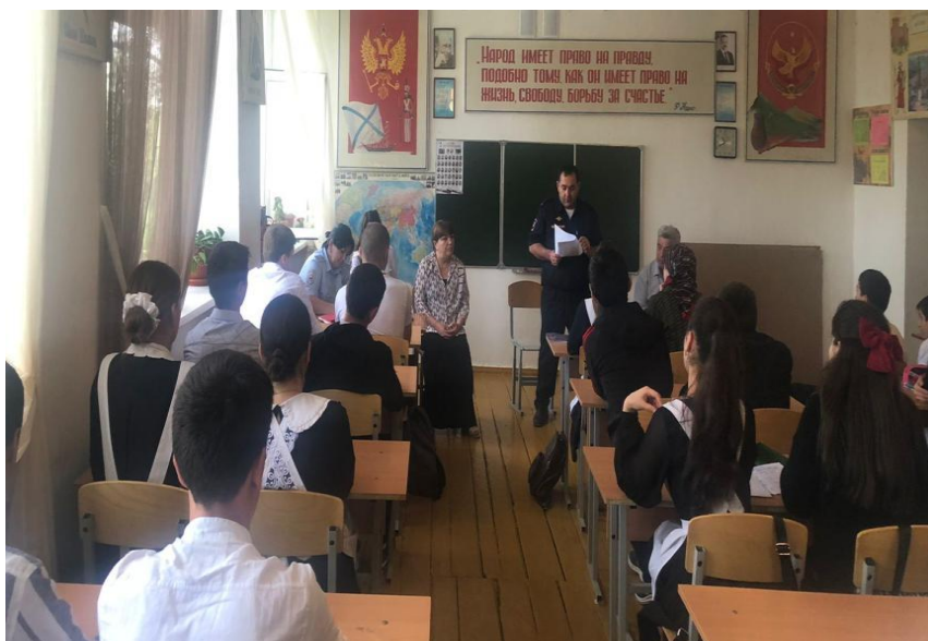
Беседа с учащимися с приглашением представителей ПДН