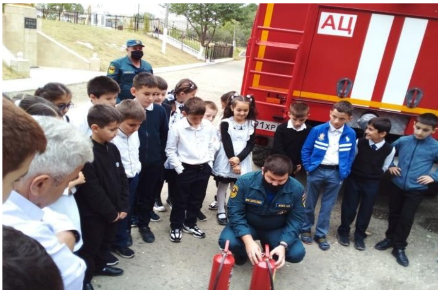
Встреча с работниками МЧС