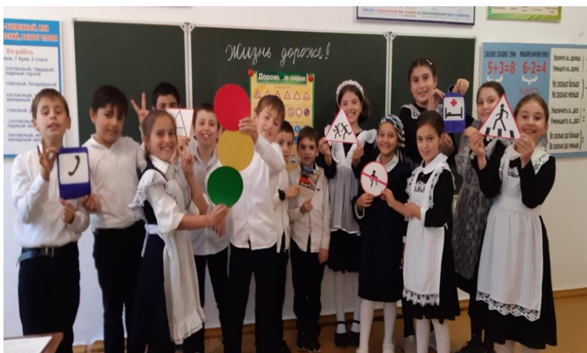
Мероприятие «Жизнь дорожке» 3Б кл.