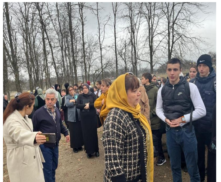
Зам.директора по ВР: