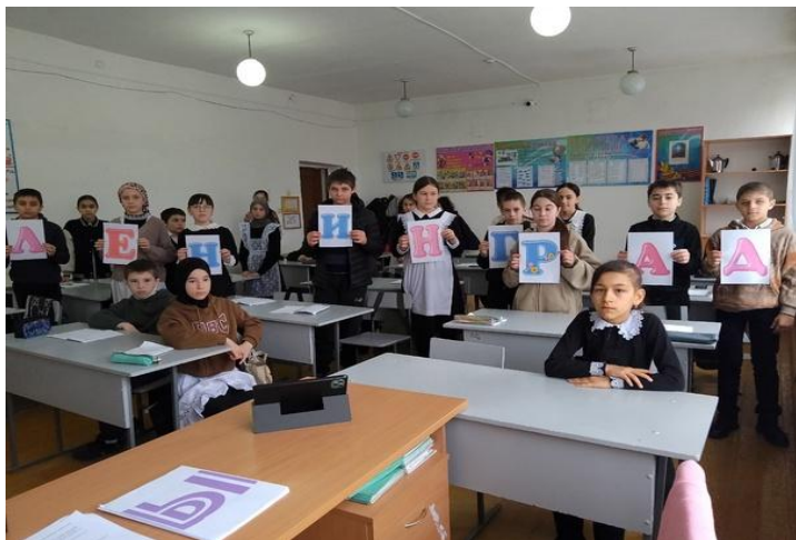
6б кл (кл.рук. Алигаджиева Д.)